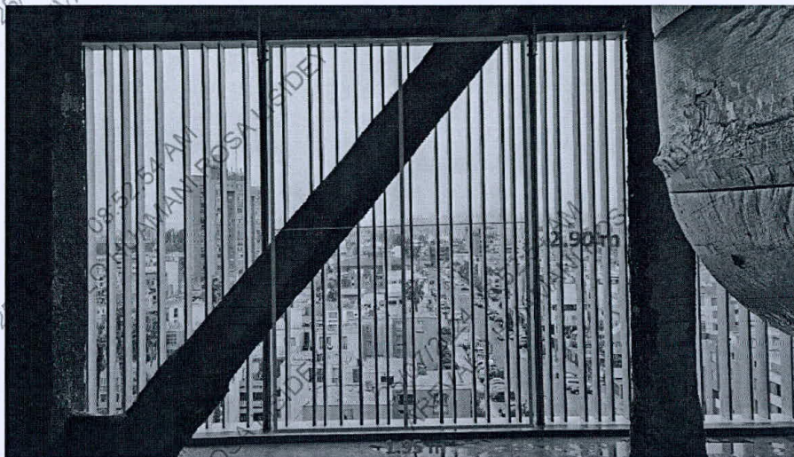
Fotografía del área de trabajo

Marco y división intermedia con tubo de aluminio de 2" x 2" (bastidor), a instalar en módulos de rejas existentes