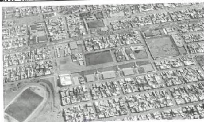
IMAGEN N° 02: UBICACIÓN ESQUEMATICA Y SATELITAL DEL TERRENO