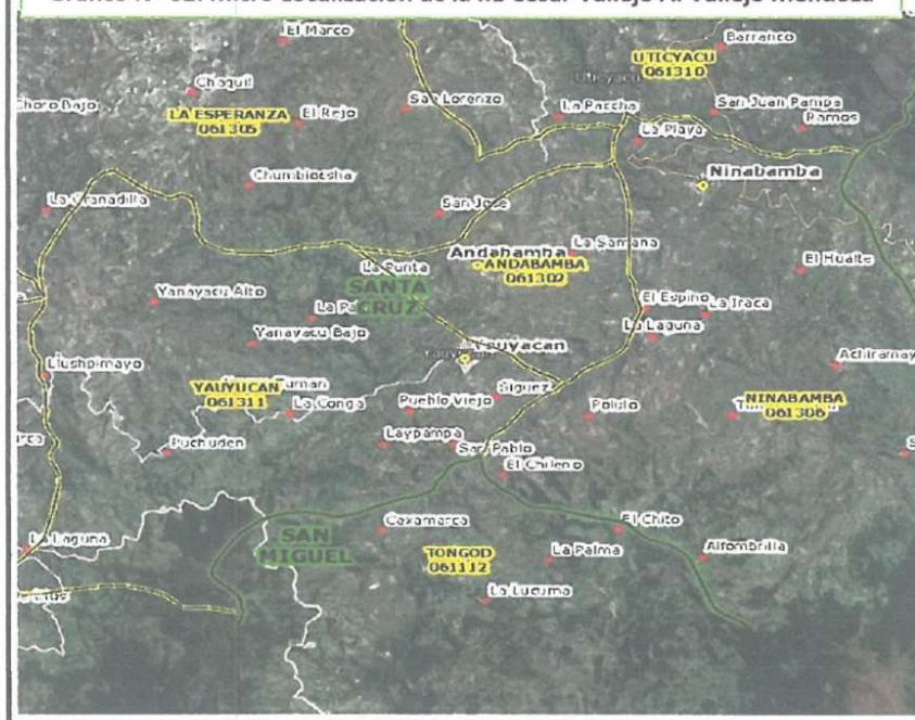
Gráfico N° 02: Micro Localización de la I.E César Vallejo A. Vallejo Mendoza

Distrito Turístico: Las Grutas de Uchucayabazo, El Troqueles, Pindas Precintas y La Laguna