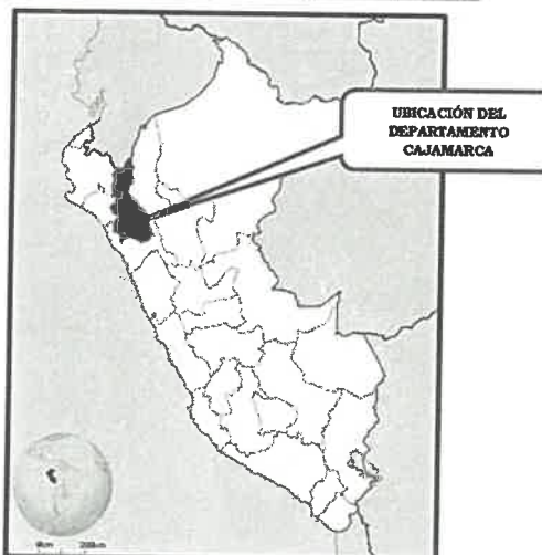
Gráfico N°01: Ubicación de la Región Cajamarca