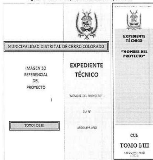
Figura 1. Forma de presentación del Expediente

Los expedientes deberán ser presentados en archivadores de palanca de lomo ancho. Cada archivador deberá considerar una carátula en la parte frontal y en lomo del mismo, para una rápida verificación. Se recomienda que dichas carátulas, deberán indicar como mínimo, lo indicado en la figura 1.