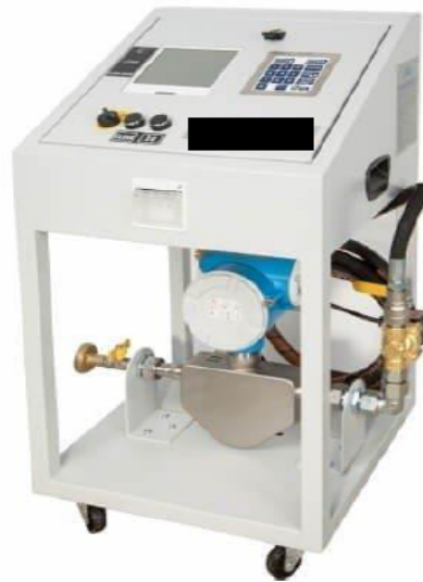
Figura N° 03. Imagen Referencial del Equipo de Flujo Másico Portátil

El equipo de flujo másico portátil de Osinergmin, tiene las dimensiones aproximadas de: 0.60 metros de largo x 0.60 metros de ancho x 1.10 metros de altura. Razón por la cual, para el traslado del equipo de flujo másico portátil, el vehículo provisto por el contratista debe tener las características mínimas que se indican: