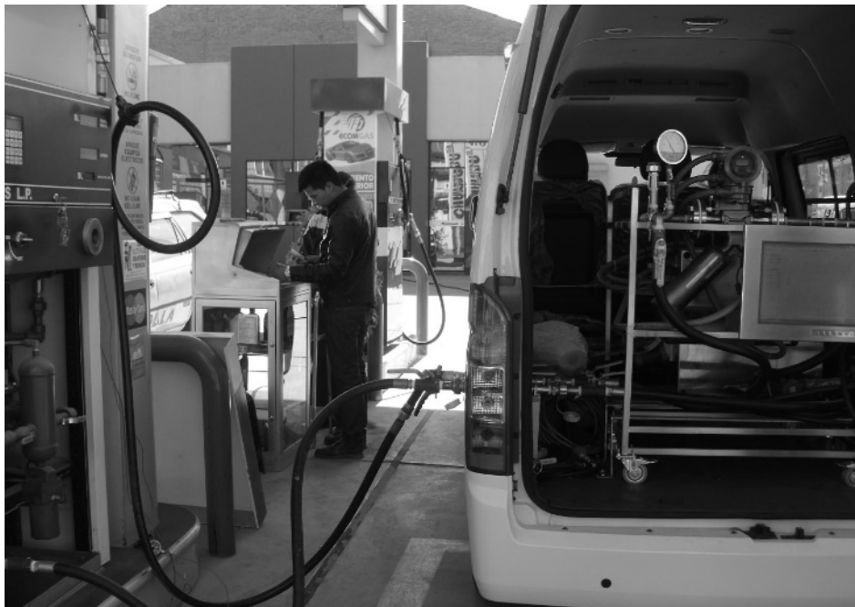
Figura N° 02. Montaje del Equipo en la parte posterior del vehículo

El Equipo de flujo másico fijo operará desde el interior del vehículo provisto por el Contratista.