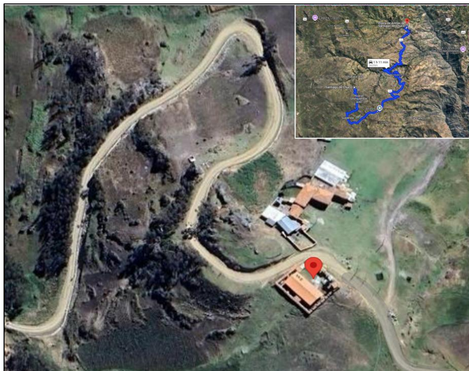
IMAGEN N 02: UBICACIÓN DEL TERRENO DEL ESTABLECIMIENTO DE SALUD HUARÁN UNINGAMBAL