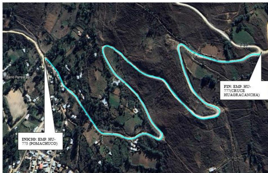
TRAMO 6: EMP. HU-775 (POMACHUCO) - EMP. HU-777 (CRUCE HUAGRACANCHA). L= 1.580 KM. R-1001018

JR. 28 DE JULIO NRO. 1363 INT. 1367-Huanuco E-mail: ivp_huanuco_2018@outlook.com