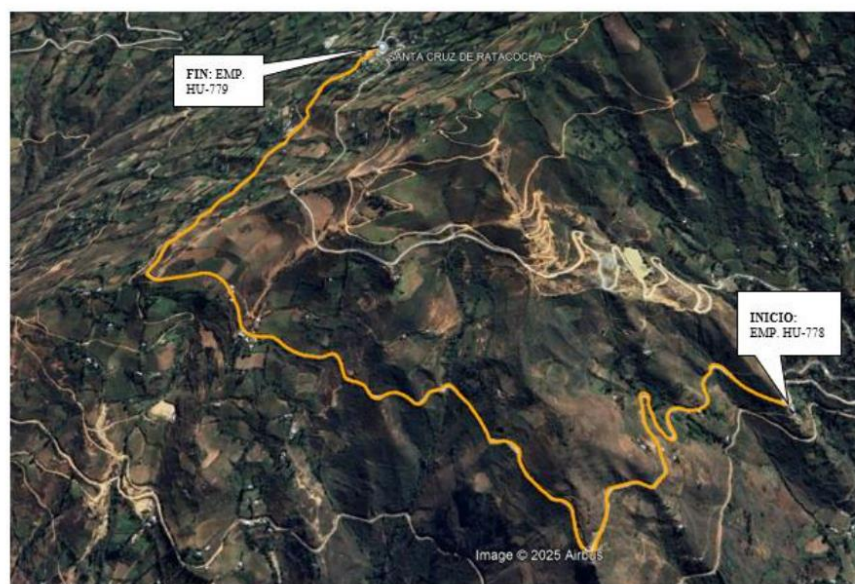
TRAMO 3: EMP. HU-778 - EMP. HU-779.. L= 4.060 KM. R-1001035

JR. 28 DE JULIO NRO. 1363 INT. 1367-Huanuco E-mail ivp_huanuco_2018@outlook.com