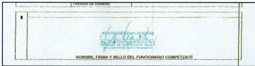
Folio 74 de la Oferta del postor Consorcio Yarinacocha

"Año del Bicentenario, de la consolidación de nuestra Independencia, y de la conmemoración de las heroicas batallas de Junín y Ayacucho"