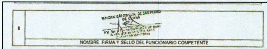
Folio 86 de la Oferta del postor Consorcio Yarinacocha