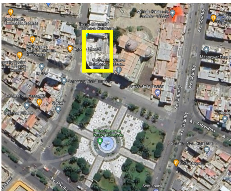
MICRO LOCALIZACION (DISTRITO DE NUEVO CHIMBOTE – PARQUE LA CULTURA)