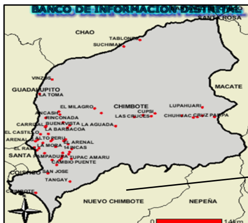
PROV. DEL SANTA