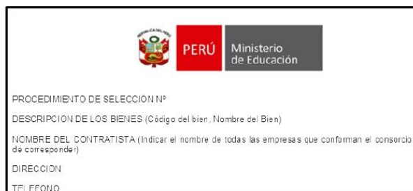
FIGURA N° 02

El logotipo tendrá el siguiente rango de medidas 8cm a 12cm de largo x 4cm a 8cm de alto