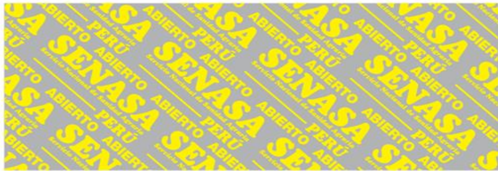
Masa Traslúcida Logo y texto amarillo (color apariencia) Gris indica Masa traslúcida