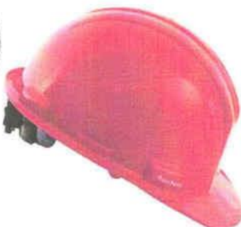
CASO DE SEGURIDAD