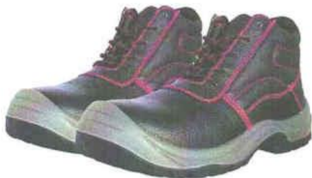
ZAPATOS DE SEGURIDAD TRABAJO – SEGURIDAD

INSTITUTO DE VIALIDAD MUNICIPAL DE LA PROVINCIA DE CAJABAMBA AÑO 2024