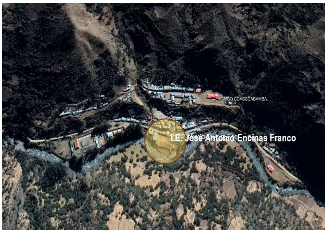
Figura 3: Ubicación de la I.E. José Antonio Encinas Franco