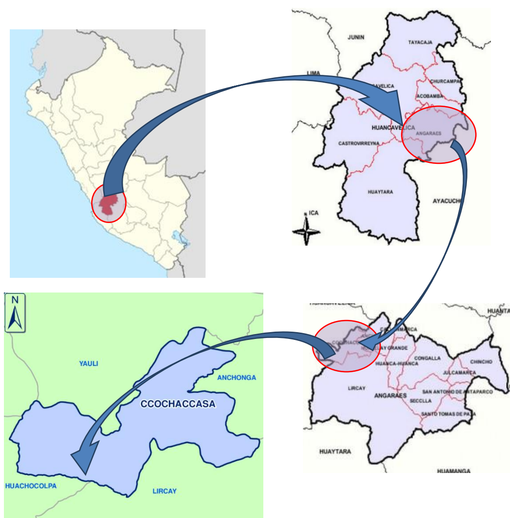
Figura 1: Macro localización de la zona del proyecto de inversión

Departamento : Huancavelica Provincia : Angaraes Distrito : Ccochaccasa Centro Poblado : Ccasccabamba Yuraccrumi Llamocca Palcas Zona : Rural