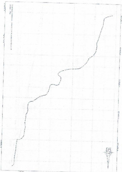
Imagen 02 Plano de Planta del Proyecto

El gobierno local de la Municipalidad Provincial del Santa a través de la Gerencia de Infraestructura facilitara al postor que haya obtenido la buena pro toda la documentación referente al proyecto (expediente técnico) de manera impresa o de forma digital y demás documentos que sean de importancia para la ejecución del proyecto.