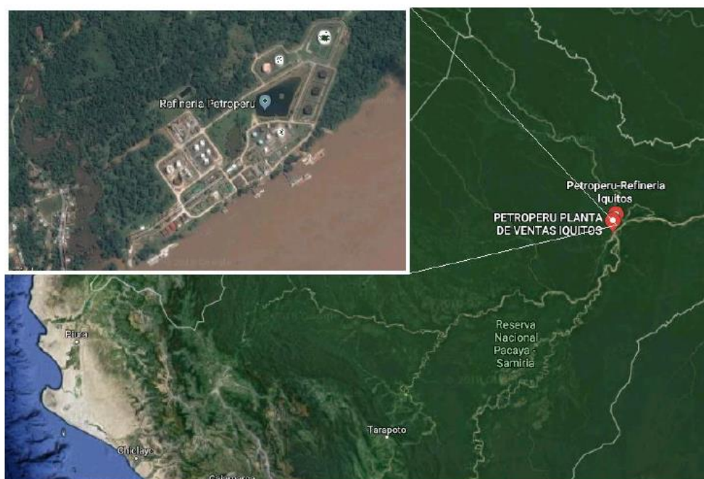
Figura N° 4.1: Plano de ubicación de Refinería Iquitos y Planta de Ventas Iquitos, Loreto.

Las instalaciones de Refinería Iquitos se encuentran ubicada a la margen izquierda del Río Amazonas, aproximadamente a 14.5 Km aguas abajo de la ciudad de Iquitos, Distrito de Punchana, Provincia de Maynas, Región Loreto. Desde RFIQ inician el recorrido de los poliductos hasta la Planta de Ventas Iquitos.