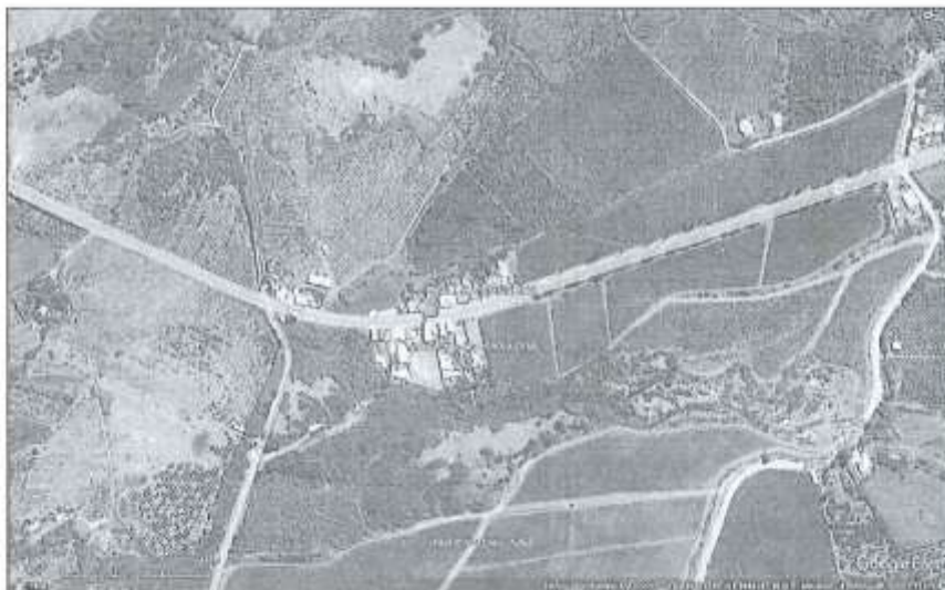
Vista del Área de Intervención del Proyecto