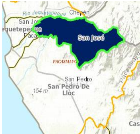
Distrito de San José