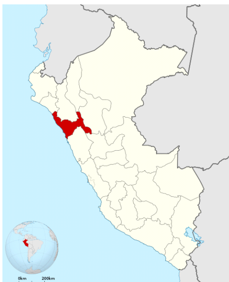
Departamento de La Libertad