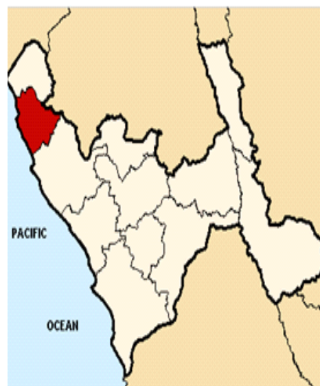
Provincia de Pacasmayo