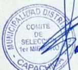
PRIMER MIEMBRO CS