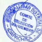
SEGUNDO MIEMBRO CS