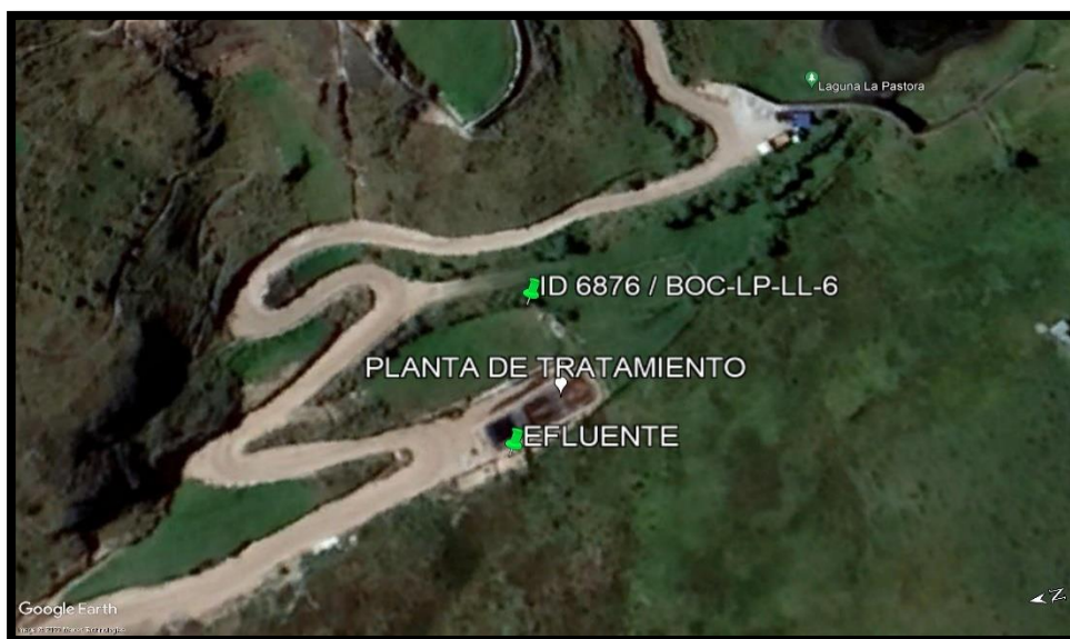
Figura 3. Ubicación de la Bocamina - ID 6876 y la descarga del efluente (agua residual industrial).