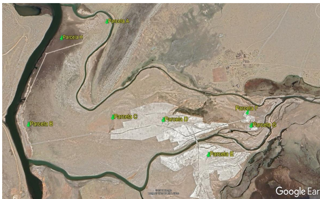
Figura N° 01: Ubicación de las zonas a intervenir en el Delta Upamayo