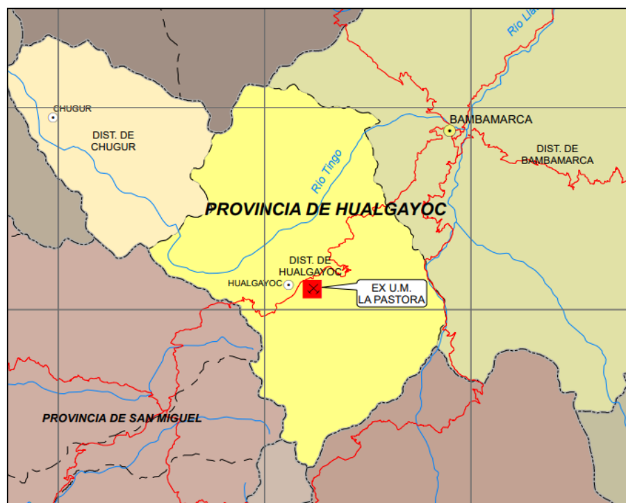
Figura 2. Ubicación de la E.U.M La Pastora.

El PAM ID 6786 (BOC-LP-LL-6 / Bocamina), se encuentra ubicado en las siguientes coordenadas: