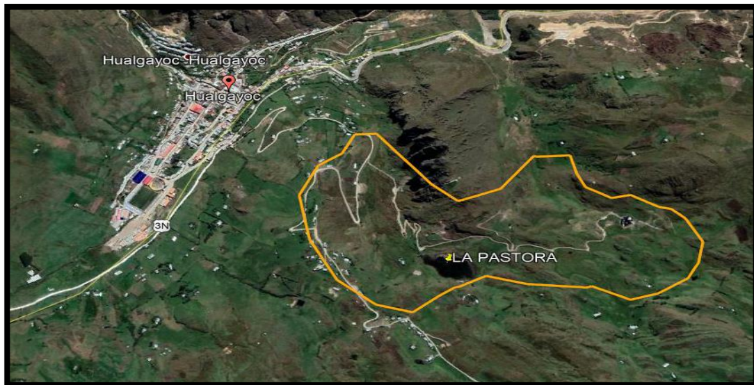
Figura 1. Ubicación de la zona del Proyecto.

Código: S4.1.P1.F3 Versión: 01 Fecha: 25/05/2022