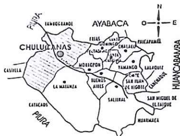
Ubicación Geográfica – Distrito de Chulucanas (Morropón)

El proyecto se ubica en la ciudad de Chulucanas - Morropón (Ver plano de ubicación U-01)