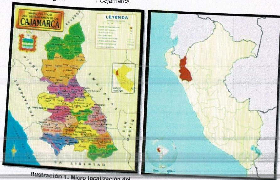
Ilustración 1. Micro localización del Departamento de CAJAMARCA.

Localidad : Ciudad de Anguía Distrito : Anguía Provincia : Chota Departamento : Cajamarca Región : Cajamarca