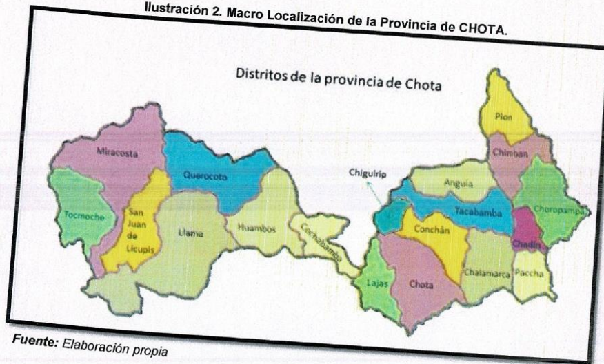
Ilustración 2. Macro Localización de la Provincia de CHOTA.

[CONSIGNAR NOMBRE DE LA ENTIDAD] [CONSIGNAR NOMENCLATURA DEL PROCEDIMIENTO]