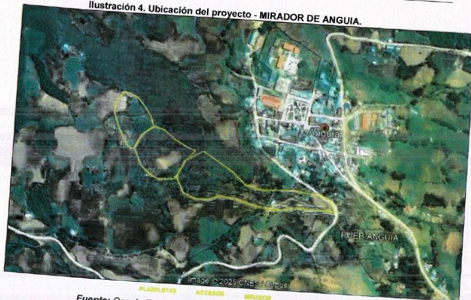
Ilustración 4. Ubicación del proyecto - MIRADOR DE ANGUIA.

[CONSIGNAR NOMBRE DE LA ENTIDAD] [CONSIGNAR NOMENCLATURA DEL PROCEDIMIENTO]