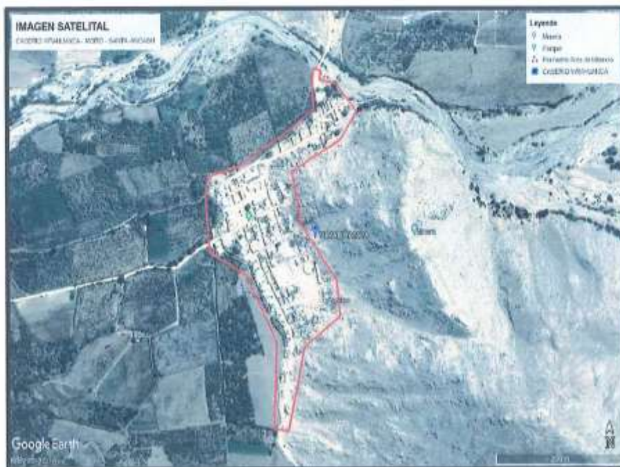
Imagen 1: SE OBSERVA EL CASERIO DE VIRAHUANCA

En la figura se muestra la localidad de virahuanca del distrito de Moro.