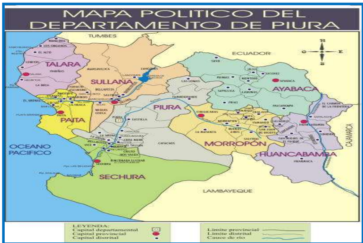
Grafica N.º 01. Ubicación Geográfica del Proyecto