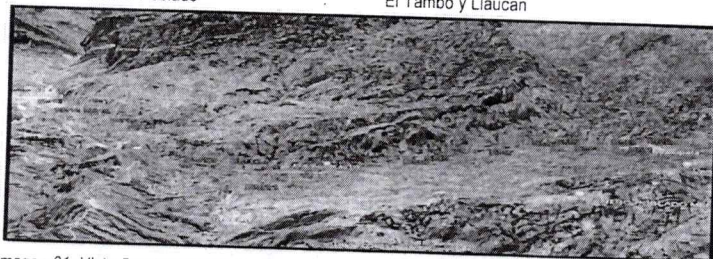
Imagen 01: Vista Satelital Google Earth.