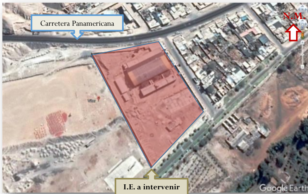
IMAGEN N° 01: ubicación terreno a intervenir, está ubicado en la zona urbana del distrito de Vitor ya consolidada que cuenta con todos los servicios básicos.