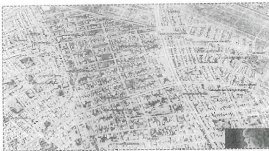
IMAGEN SATELITAL 02: Se aprecia la zona de intervención, que corresponde al A.H. LA MOLINA