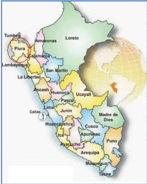
Gráfico N° 01: Mapa del Perú