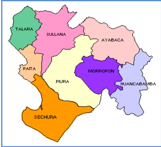
Gráfico N° 03: Micro localización