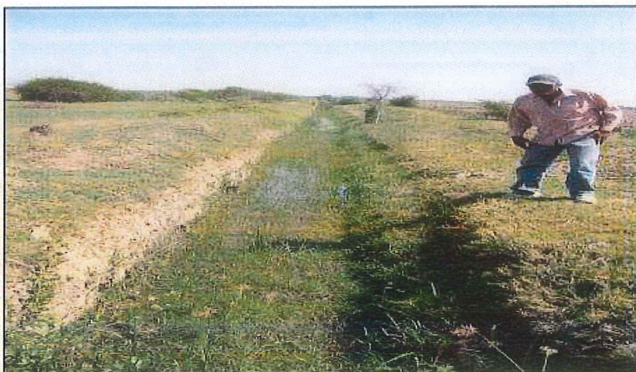
Estado actual del canal Galpón