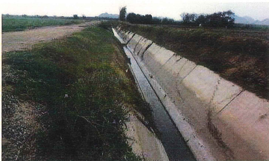
Estado actual del canal L-2 Zanjón antes del Canal Galpón

El canal L2 Zanjón, inicia en el partidor "Pinino" a donde llega el canal L-1 Ucupe, tiene una longitud total aproximada de 3.96 km, con una capacidad de 1.80 m 3 /s, beneficiando con el servicio de riego a 1,403.70 ha. del sector de Ucupe, recorriendo por un tramo de textura franco arenosa, hasta el km 1+400 aproximadamente en el cruce con la carretera panamericana, de donde inicia el tramo que se encuentra revestido de concreto en una longitud de 2.26 km, hasta llegar al partidor San Miguel-La Manga.