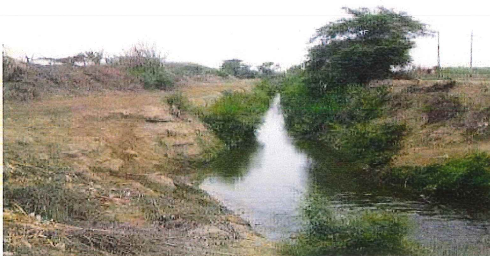
Canal de Derivación Ucupe Mocupe

El canal Mocupe-Ucupe, es el que va a derivar las aguas del río Zaña hasta el sector de Los Peroles (San Miguel) de Ucupe. Parte de la bocatoma de material noble ubicada en el Km. 30+600 del río Zaña a aproximadamente 1.00 km aguas arriba del puente colgante de Zaña por la margen izquierda, se encuentra ubicada en el ámbito del sector de la Otra Banda, en el distrito de Zaña. Tiene una longitud total de 7.29 Km. de los cuales 250 metros iniciales se encuentran revestidos con concreto. Tiene una capacidad de 4.5 m 3 /s, y va a abastecer a los canales L1- Mocupe que va a al sector Mocupe y L-1 Ucupe.