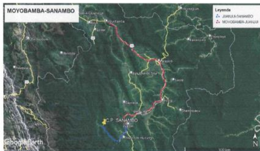
Imagen 2: Vista del Recorrido desde Moyobamba hasta Sanambo

“ALGO DEL DESTINO DE LA COMPLEJIDAD DE NUESTRA IDENTIDAD, Y DE LA COMPLEJIDAD DE LAS RELACIONES ENTRE EL MUNDO Y EL MUNDO”