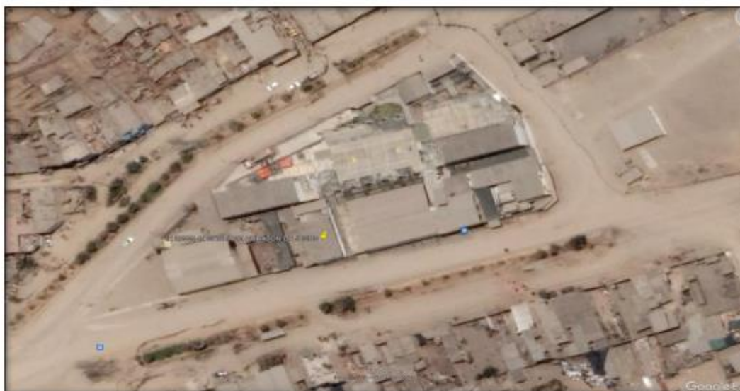
Figura 2: Ubicación de la Obra