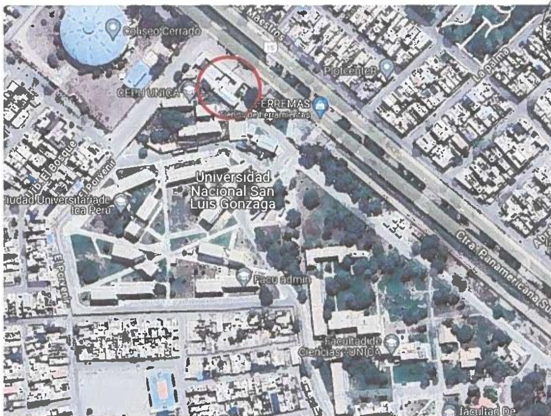
Imagen. Ubicación de la Unidad De Infraestructura Y Mantenimiento campus de la Ciudad Universitaria Sede SL01 de la Universidad San Luis Gonzaga de Ica

La, Unidad De Infraestructura Y Mantenimiento se encuentra ubicada en la Provincia de Ica, cuyo terreno se encuentra inscrito en los registros públicos a favor de la Universidad.