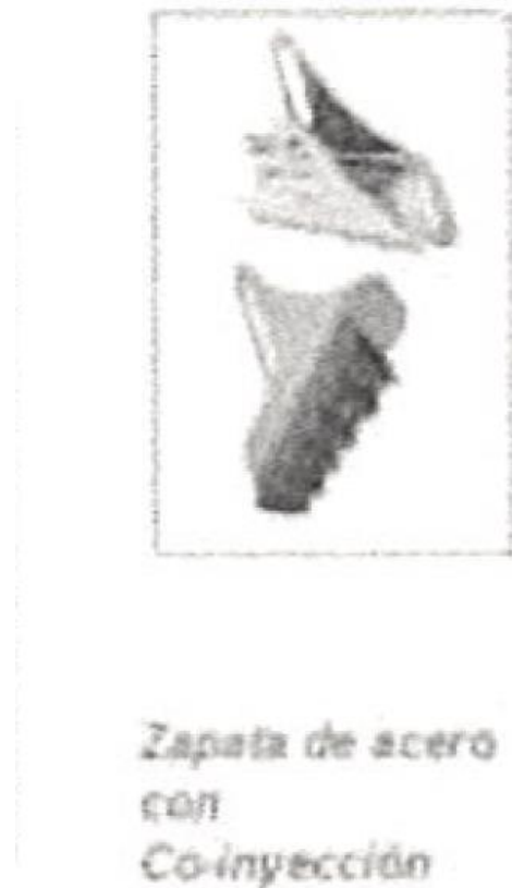
Imagen 2, Extraída de la oferta del postor CONSORCIO CHAMBI