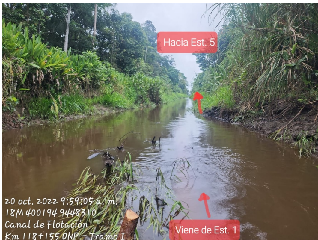
Foto N° 1.3 -Sector socavado donde la tubería ha quedado expuesta 36m. Vista hacia la Estación 5, limpio y sin vegetacióncon, por mayor velocidad de las aguas del canal de flotación. (Fecha 20.10.2022)