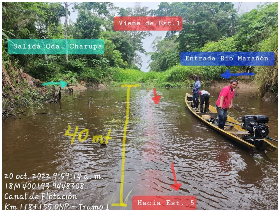
Foto N° 1.1- Sector socavado donde la tubería ha quedado expuesta 36m. Obsérvese la tubería sumergida por el alto nivel de las aguas en el canal de flotación, no obstante estar en el periodo de estiaje. Vista hacia la Estación 1, con abundante presencia de vegetación en canal de flotación, producto de la sedimentación de un tramo de aprox. 200 m. (Fecha 20.10.2022)