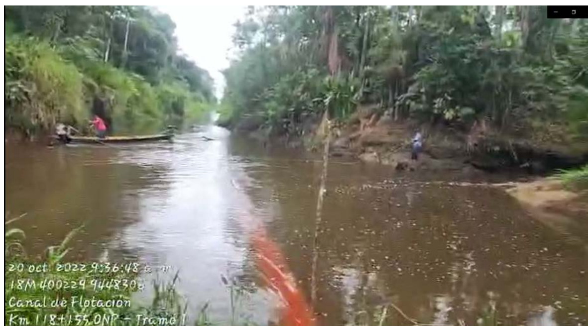
Foto N° 1.2- Vista desde la Estación 1 hacia la Estación 5, en sentido del flujo del ONP. A lado derecho se observa el cauce de la Qda que atraviesa el canal de flotación, drenando sus aguas hacia el río Marañón. (Fecha 20.10.2022)