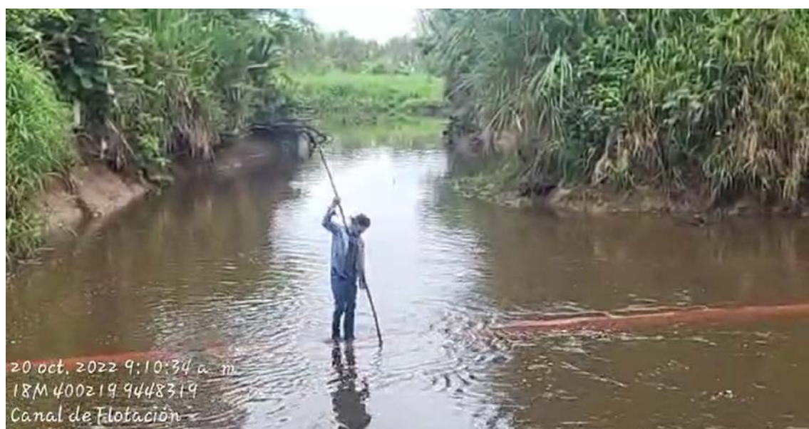
Foto 1.4 – Obsérvese el canal de salida de las aguas del canal de flotación hacia la margen izquierda del río Marañón. Cuando el río Marañón crece, por el mismo lugar ingresan sus aguas, represando las del canal de flotación. (Fecha 20.10.2022)