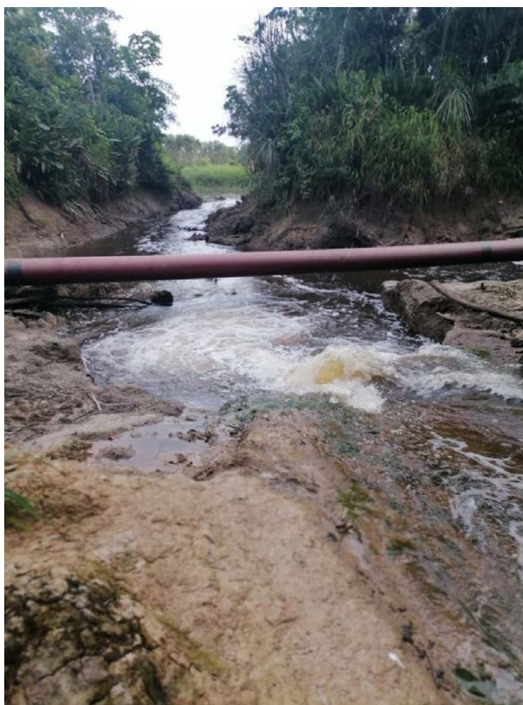
Foto N° 1.5- Determinación del estado de la tubería al 20.12.2022, luego del descenso de las aguas del río Marañón y del Canal de Flotación. El flujo de agua que se observa, corresponde al de la Qda que cruza perpendicularmente el canal de flotación y la tubería, para desembocar en el río Marañón.