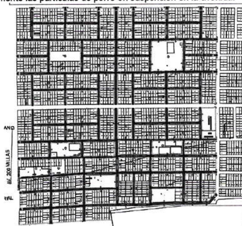
Imagen 1: Planta General del Proyecto de Inversión.