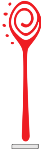
DISEÑO REFERENCIAL DE LA CUCHARA VOLUMÉTRICA REQUERIDA POR PROMPERÚ