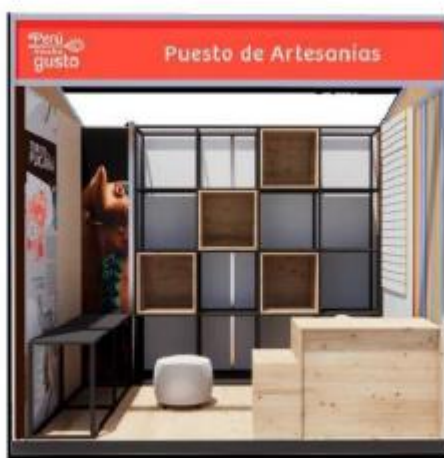
DISEÑO REFERENCIAL DEL STAND ARTESANÍAS REQUERIDO POR PROMPERÚ