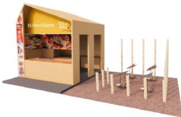
DISEÑO REFERENCIAL DEL STAND COCINAS DE CAMPO (HUMOS) REQUERIDO POR PROMPERÚ