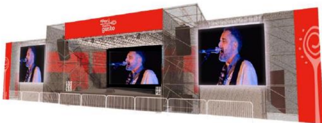
DISEÑO REFERENCIAL DEL ESCENARIO DE PRESENTACIONES MUSICALES REQUERIDO POR PROMPERÚ