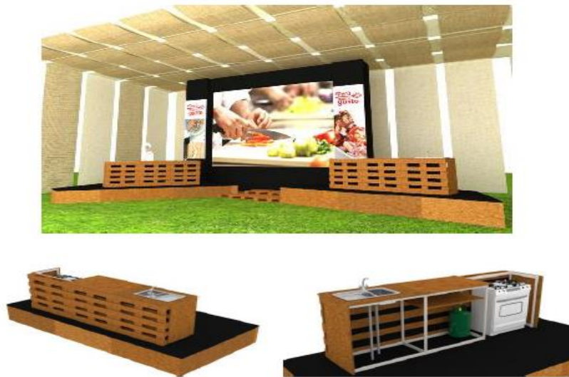
DISEÑO REFERENCIAL DE LA CLASE MAGISTRAL (SHOW COOKING) REQUERIDO POR PROMPERÚ