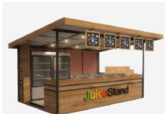
DISEÑO REFERENCIAL DEL STAND DE BEBIDAS NATURALES REQUERIDO POR PROMPERÚ