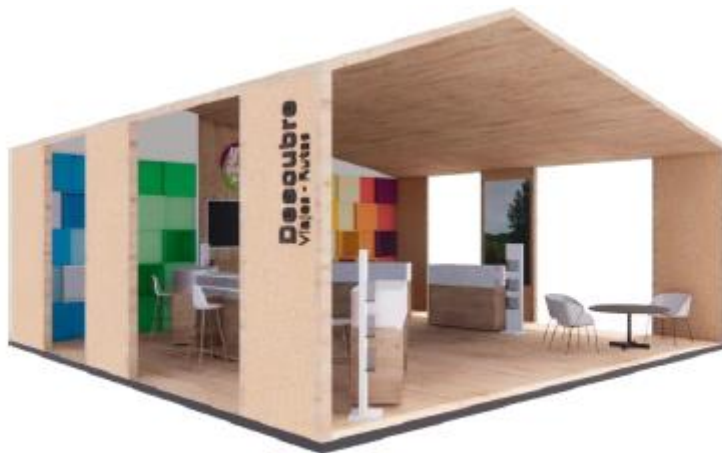
DISEÑO REFERENCIAL DEL STAND YTUQUEPLANES REQUERIDO POR PROMPERÚ