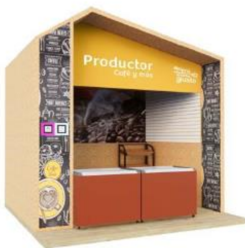
DISEÑO REFERENCIAL DEL STAND DE PRODUCTOS REQUERIDO POR PROMPERÚ