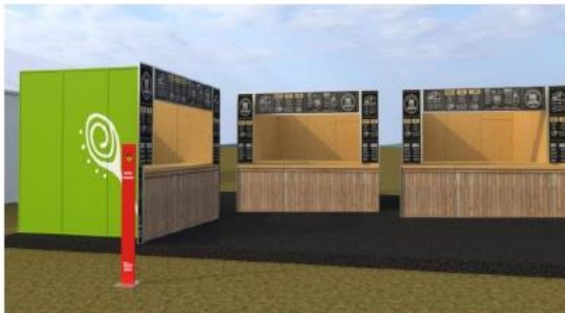
DISEÑO REFERENCIAL DEL STAND ARTESANÍAS REQUERIDO POR PROMPERÚ