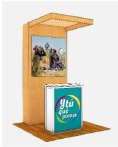
DISEÑO REFERENCIAL DEL MÓDULO DE TURISMO REQUERIDO POR PROMPERÚ