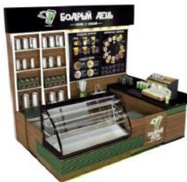
DISEÑO REFERENCIAL DEL STAND DE POSTRES REQUERIDO POR PROMPERÚ