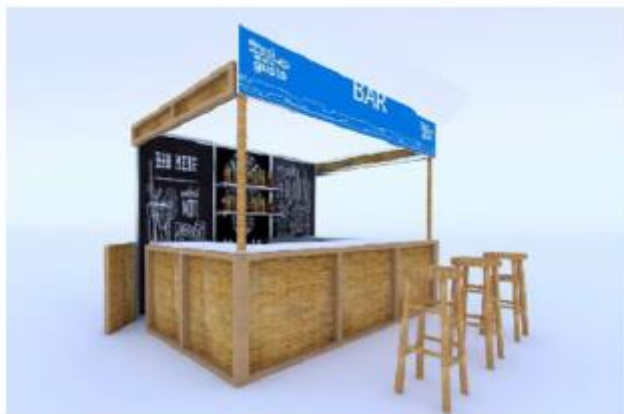
DISEÑO REFERENCIAL DEL STAND DE BARES REQUERIDO POR PROMPERÚ