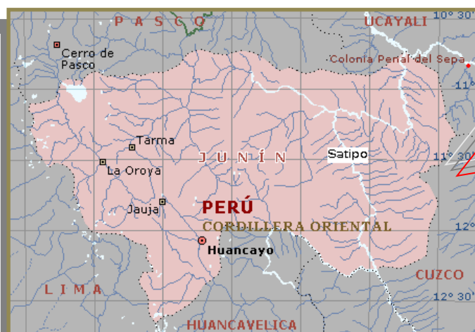
Figura N° 01: Mapa del Perú

Centro Poblado : Chacaybamba Distrito : Monobamba Provincia : Jauja Departamento : Junín