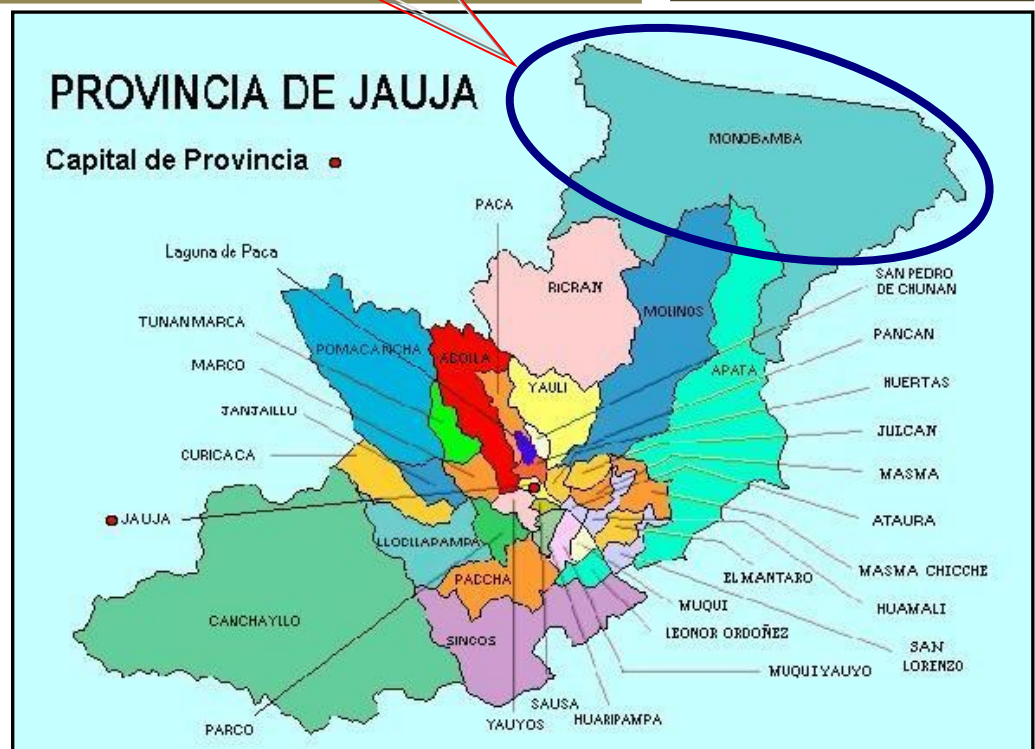
Figura N° 04: Mapa de la Provincia de Jauja y Distritos – Ubicación Provincial del Distrito de Monobamba