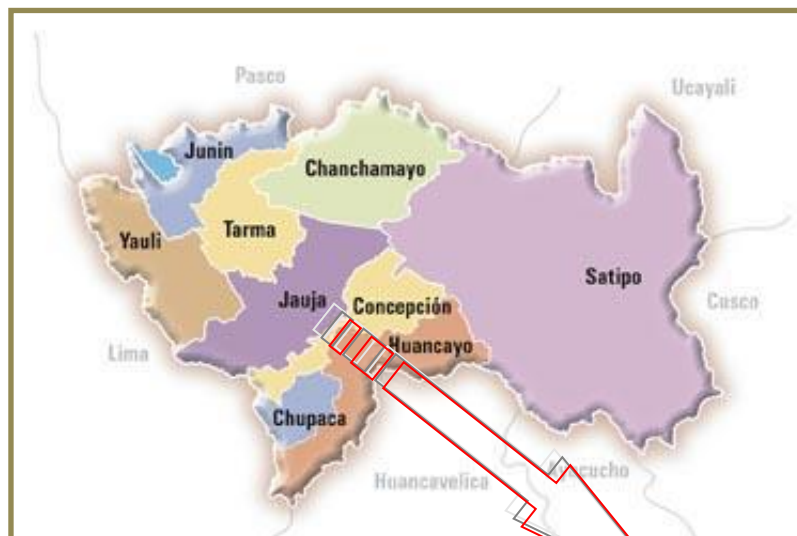
Figura N° 03: Mapa de la Región Junín y Provincias