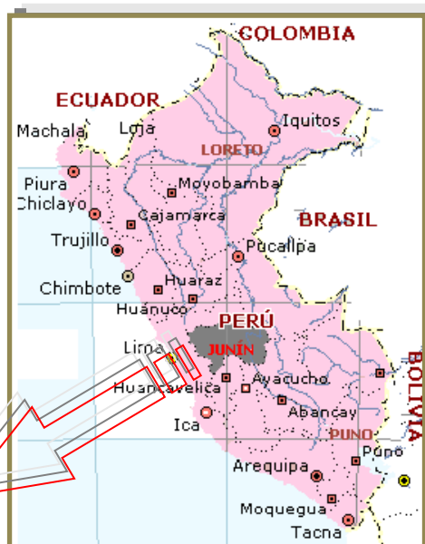
Figura N° 02: Mapa de la Región Junín