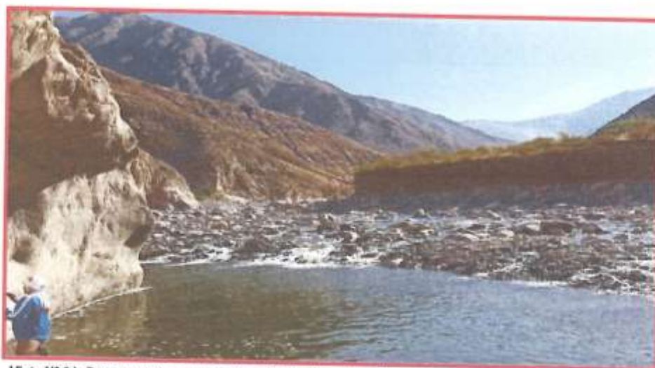
Vista N° 01: Bocatoma de canal de riego Piedra Cruz afectado por fuertes lluvias.

Punto de Inicio : Prog. 1+060 (586543.57 m E, 8354453.48 m S) Punto Final : Prog. 1+150 (586485.31 m E, 8354386.43 m S) Aproximadamente : 90.00 ml. de canal a rehabilitar.