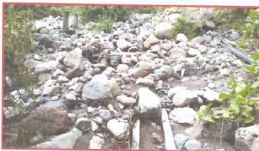
Vista N° 04: Canal de Riego Piedra Cruz con fisuras en la base con pérdida de agua.