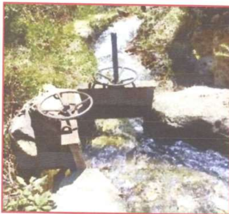
Vista N° 05: tomas laterales a rehabilitar del canal Piedra Cruz

Toma lateral III : 1+480 Toma lateral IV : 2+080 Toma lateral V : 2+160 Toma lateral VI : 2+220