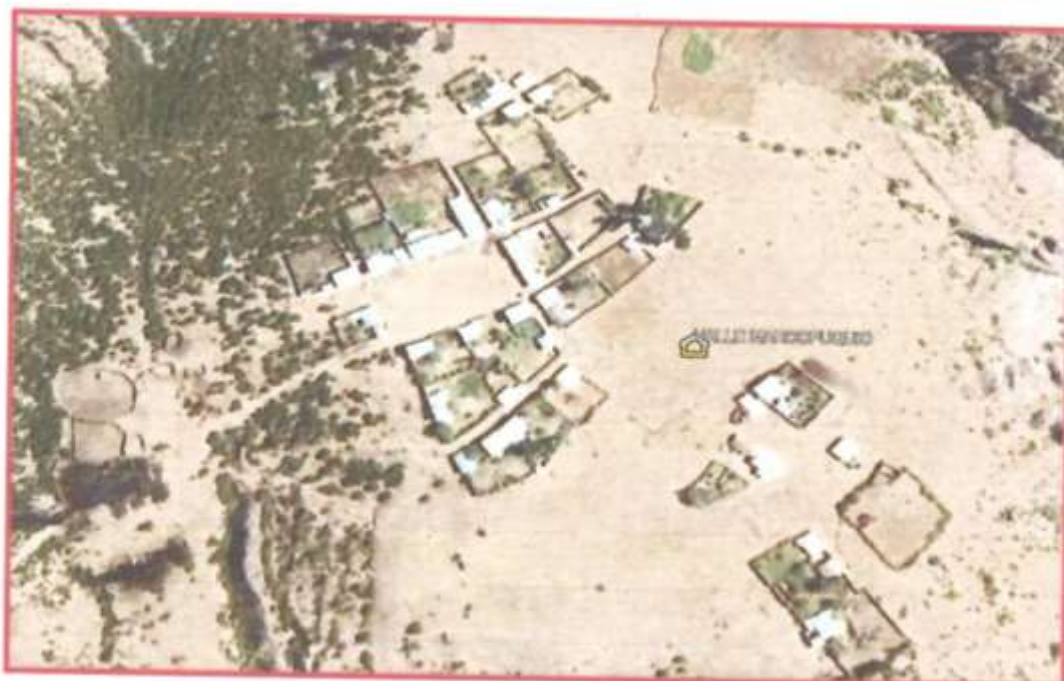
Figura 04: Imagen Fotográfica de la ubicación del proyecto – localidad Valle Marco Puquio (Canton Piedra Cruz)