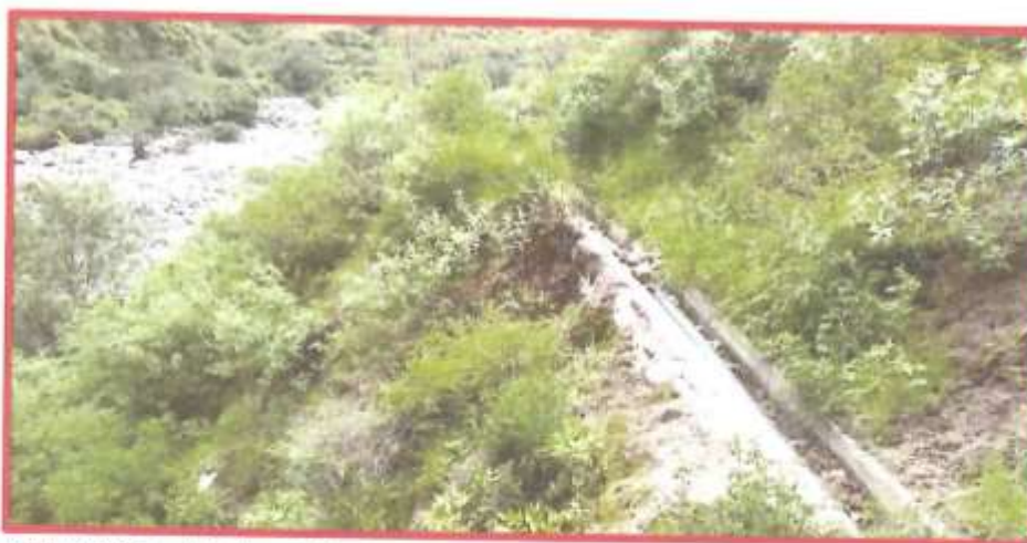
Vista N° 02: Canal de Riego Piedra Cruz socavado y desgastado en distintos tramos

Punto de Inicio : Prog. 1+340 (586418.20 m E, 8354212.05 m N) Punto Final : Prog.