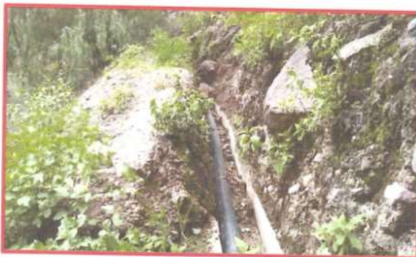
Vista N° 03: Canal de Riego Piedra Cruz con fisuras en la base con pérdida de agua

Aproximadamente: 110 ml. de canal a rehabilitar.