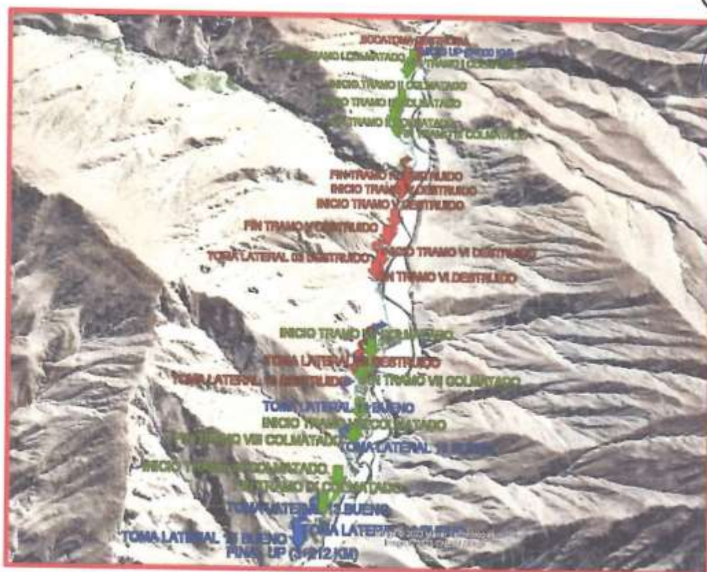
Figura 03: Imagen satelital de la ubicación del proyecto – (Canal Piedra Cruz)