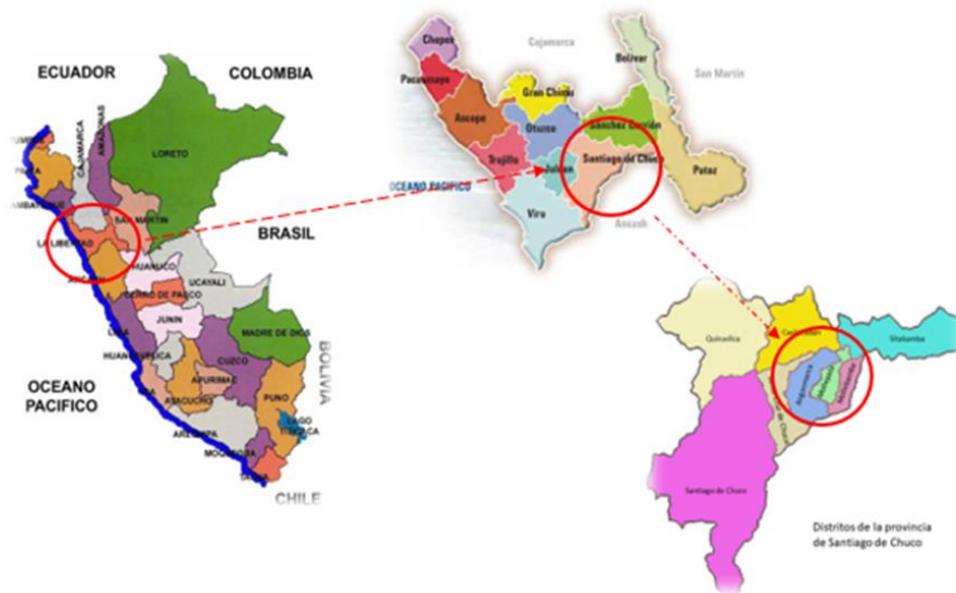
Figura2. Mapa de la Provincia de Santiago de Chuco