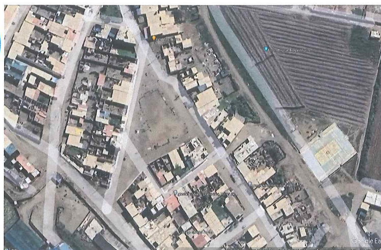
FIGURA N° 1 UBICACIÓN DEL PROYECTO