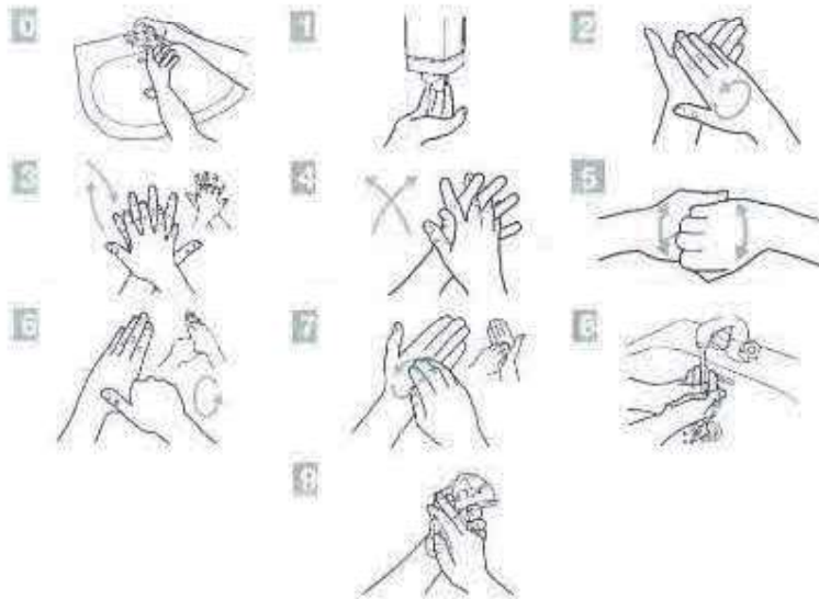
Imagen N°01. Pasos de lavado de manos.