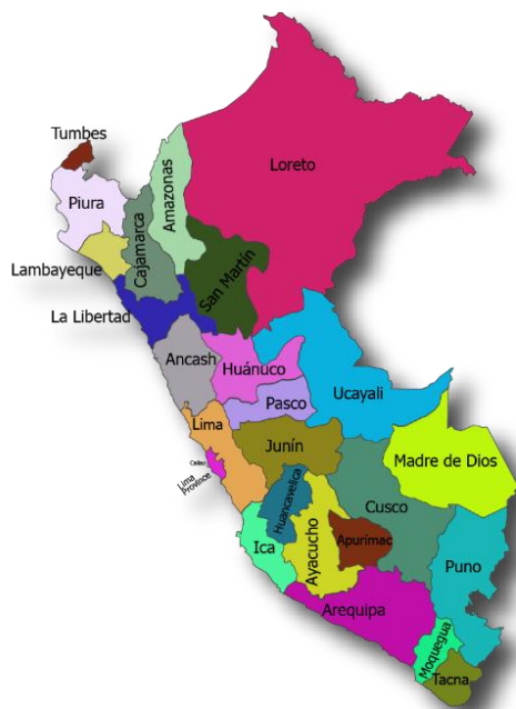
Mapa: Político del Perú