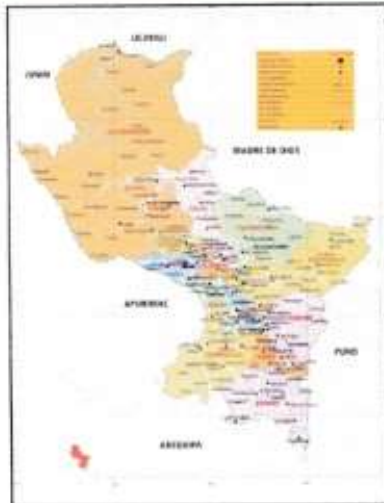
MAPA POLITICO DE CUSCO