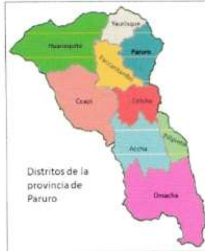
MAPA POLITICO DE PARURO