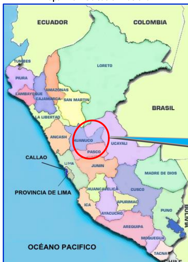
Mapa N°01: Ubicación Nacional