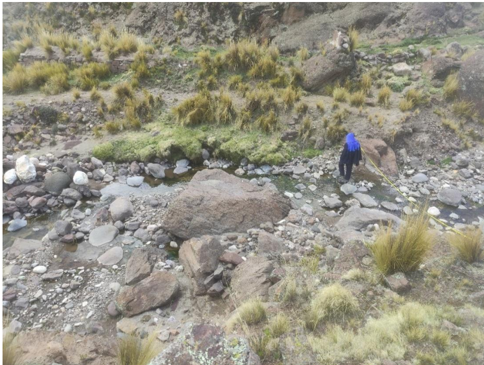
Foto N°05.- Vista de los caminos vecinales que dificulta el transporte de carga y pasajeros en épocas de lluvias

productores por el elevado costo que ocasiona la deficiente accesibilidad de las vías vecinales que no permite la accesibilidad de transporte de carga ocasionando mayores costos y pérdida de tiempo.