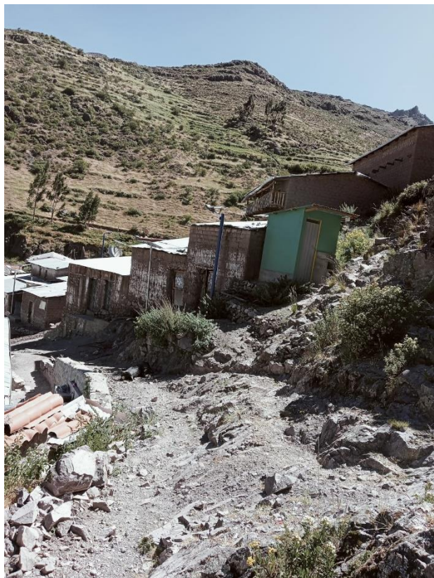
Foto N°08.- Vista de los caminos vecinales, se observa la necesidad de construir y mejorar la trocha carrozable para poder beneficiar a los poblados de Tincocc, Cruz Pata y Putcca

Por lo que se puede concluir que, en la zona del proyecto, las deficientes vías carrozables genera el aislamiento de los pueblos, inadecuada extensión comercial de sus productos, inaccesibilidad a los servicios básicos, bajo conocimiento de sus costumbres y centros turísticos. Se quiere revertir el difícil acceso de las vías de comunicación, a estas comunidades de los distritos de San Francisco de Sangayaico y Santiago de Chocorvos, permitiendo la Integración Social y Económica entre los pueblos, la comercialización de sus productos agrícolas y pecuarios en menor tiempo.