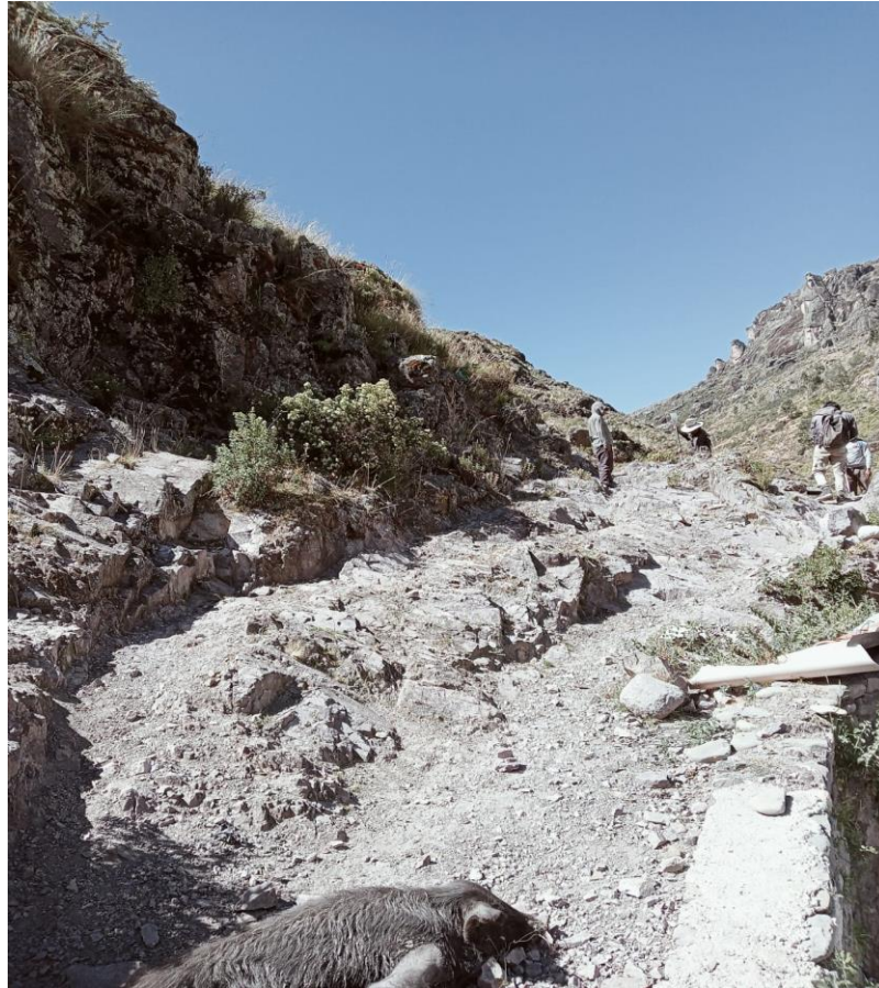
Foto N 06.- Vista del camino vecinal deteriorado que dificulta el transporte de carga y pasajeros, resulta intransitable.

La educación impartida en los distritos de San Francisco de Sangayaico y Santiago de Chocorvos es de bajo rendimiento, se tiene nivel primario en casi todas las comunidades del distrito, pero los centros educativos de nivel secundario solamente se ubican en algunas comunidades, los docentes vienen de la ciudad de Huaytará, Huancavelica y otras localidades cercanas a dictar clases. los profesores y alumnos son afectados con la inaccesibilidad de las trochas carrozables donde se puedan movilizar en vehículos, por contrario, realizan grandes caminatas por herraduras a sus respectivas Instituciones Educativas, los alumnos no pueden asimilar sus clases con normalidad ya que muchas veces llegan retrasándose en el horario y muy cansados pese a que tienen que levantarse muy temprano y emprender largas caminatas para ganarle al tiempo, desmotivando su desenvolvimiento con los docentes, estas inadecuadas condiciones de transitabilidad genera pérdida de tiempo en los estudiantes, reduciendo las posibilidades de estudiar, hacer tareas y complementar lo aprendido en clase. Por estas dificultades muchos alumnos optan por dejar de estudiar y ponerse a trabajar ayudando a sus padres en la agricultura u otras actividades perjudicando su nivel de aprendizaje, dándole cabida aún más al analfabetismo.