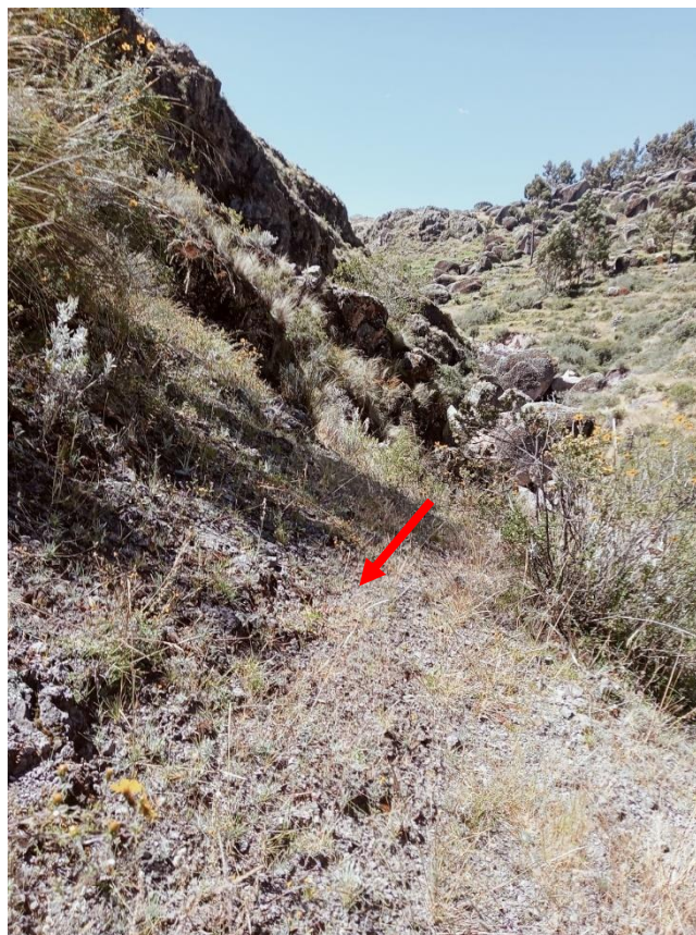
Foto N° 01.- Plataforma en mal estado, con presencia abundante de rocas pequeñas que hacen intransitable, requiere creación de vía.

Realizado el diagnostico in-situ, se pudo constatar la gran dificultad existente para transportar fluidamente los productos agropecuarios a los distintos mercados locales o simplemente transportar pasajeros debido principalmente a las inadecuadas vías vecinales y a las malas condiciones de mantenimiento en que se encuentran las vías vecinales existentes que constituyen el eje vial y de comunicación entre las comunidades y anexos de los distritos de San Francisco de Sangayaico y Santiago de Chocorvos. Veamos las siguientes evidencias.