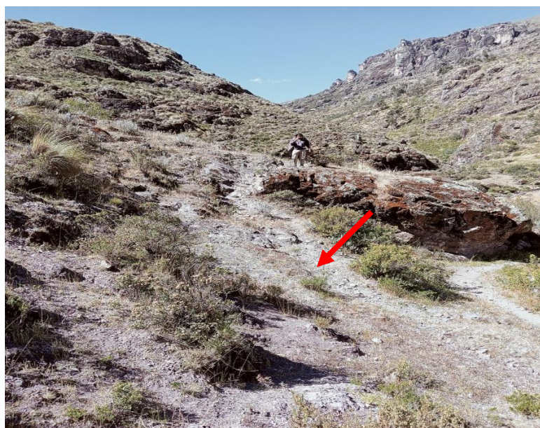
Foto N° 03.- La falta de una trocha carrozable, hace muy largas las horas de viaje hacia los centros poblados.

La inexistencia de obras de drenaje y las intensas lluvias que se presentan en estas comunidades generan, la inexistencia de cunetas generaron grietas, en zonas rocosas la plataforma fue obstruida de modo que debe realizarse nuevos cortes para garantizar el ancho mínimo, por ello debe hacerse nuevos cortes debido a las características de la roca, en la que la presencia de la arcilla es muy relativamente abundante, se requiere el corte de talud a nivel de sub rasante, como consecuencia a falta de un mantenimiento de esta superficie, los transeúntes dejaron de transitar por estos lugares, siendo los pobladores de estas comunidades los más afectados, porque ellos tienen que recorrer largas caminatas.