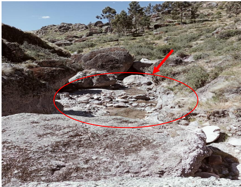
Foto N° 02.- Inexistencia de obra de arte, hace intransitable la vía en épocas de lluvia

que transitan estas vías para llegar a tiempo a las ferias locales, se puede apreciar en la siguiente fotografía.