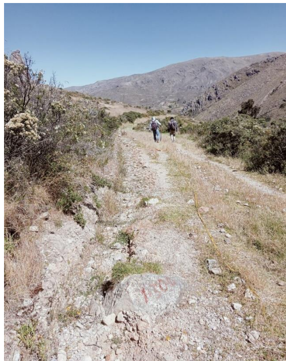
Foto N°04.- Vista de los caminos de herradura que dificulta el transporte de los productos que enlazan a los pueblos de San Francisco de Sangayaico y Santiago de Chocorvos

Por esto muchas veces los agricultores de esta zona de influencia cultivan sus productos solo para autoconsumo y el excedente mínimo que se tiene lo comercializan a través del trueque entre ellos mismos, es decir intercambian sus productos pese a que no pueden sacar sus productos a comercializar con otros