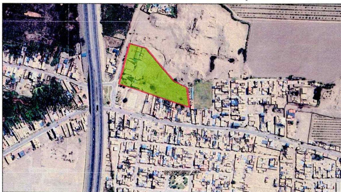
Imagen 2: Vista Satelital del Ámbito de Influencia del Proyecto