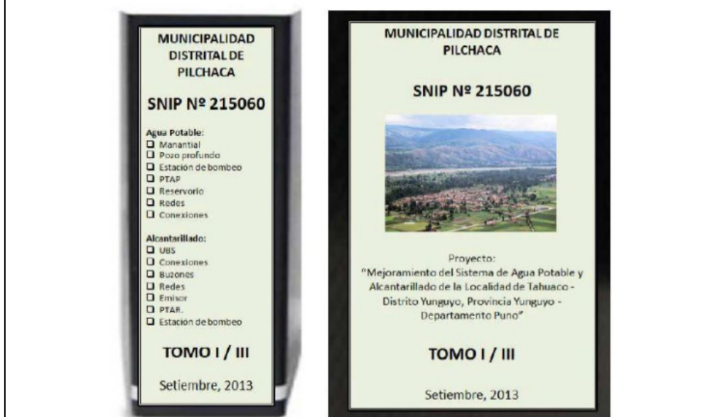
Figura 1. Forma de presentación del Expediente Contenido