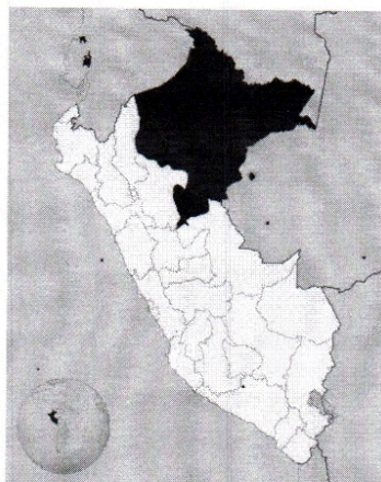
UBICACIÓN DE LA REGION LORETO