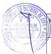
CUADRO 04 - OTRAS PENALIDADES

Por otro lado, de acuerdo Reglamento de la Ley de Contrataciones de Estado, se establecen penalidades de forma independiente a la penalidad por mora, establecidas en el siguiente cuadro: