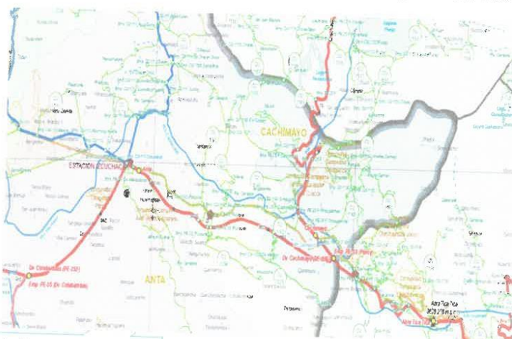
Camino Vecinal: Cachimayo – Villa Del Carmen