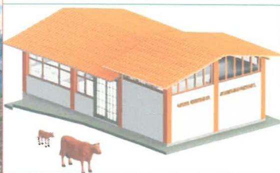
Camal con el Mejoramiento